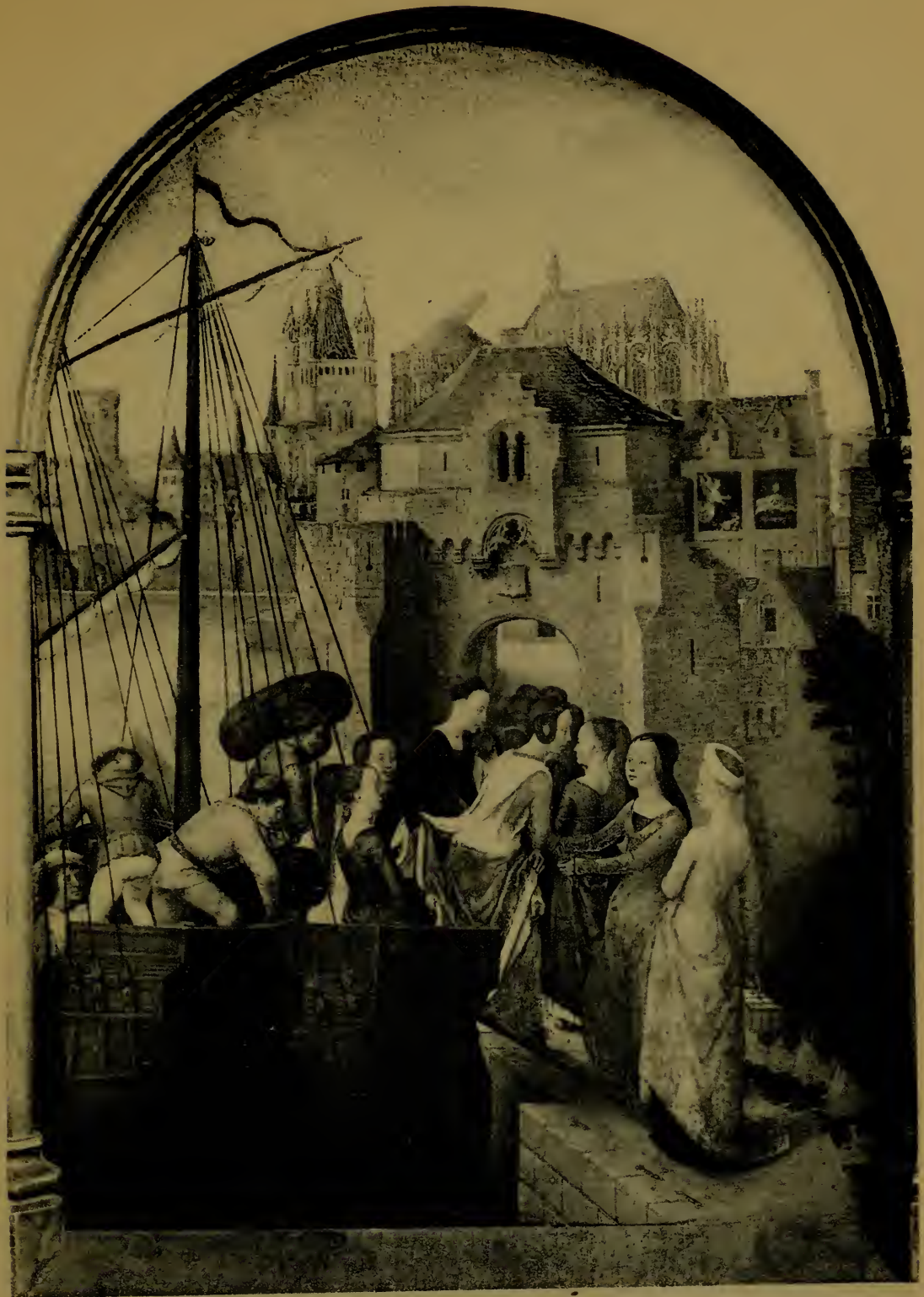
L'Arrivée à Cologne Premier panneau de la Châsse de Ste-Ursule.